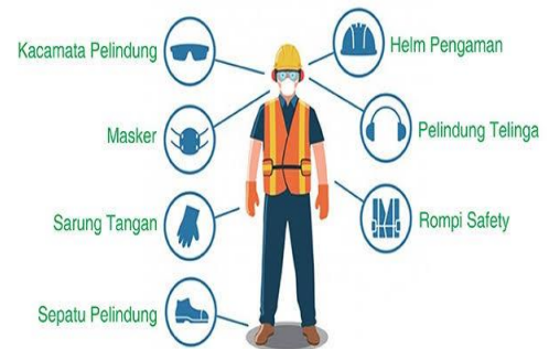
Alat Pelindung Diri (APD)