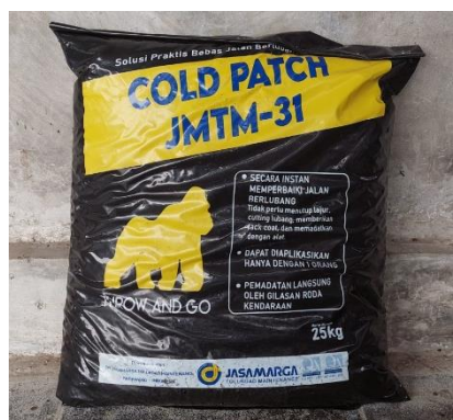
Aspal TCM (Tambal Cepat Mantap)