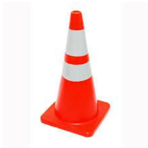
Kerucut Lalu lintas