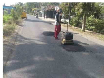
Perbaikan dan Pematatan