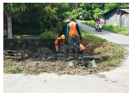
Pembersihan Saluran Drainase