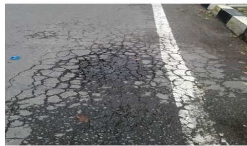
Jalan berlubang dan retak-retak