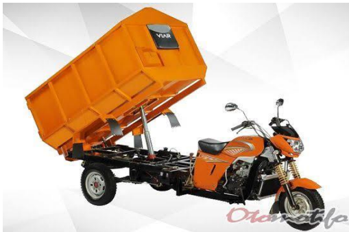
Sepeda Motor Roda Tiga