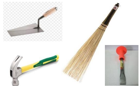
Alat Bantu Lain